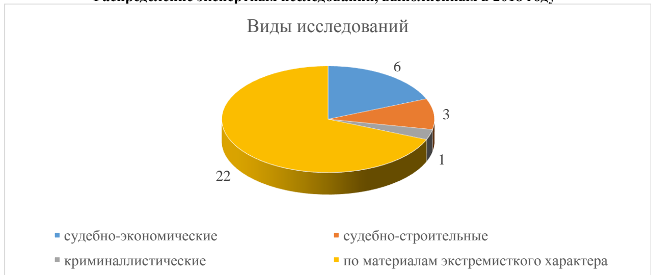
Распределение экспертных исследований, выполненных в 2018 году

Из числа выполненных исследований необходимо выделить исследования по делам, которые вызвали широкий общественный резонанс, а именно: исследования по строительству газопровода в Златоустовском городском округе, по деятельности в социальных сетях групп «Синий кит» и «Мизантропик Движин».